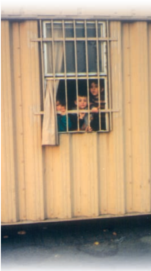
Porto di Otranto (Lecce). Immigrati clandestini nei containers che li "ospitano" appena dopo fermati dalle forze dell'ordine.