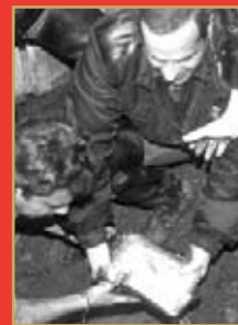
Inchiesta La piaga della droga