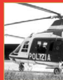
Problematiche settore aereo In prima linea per la specialità